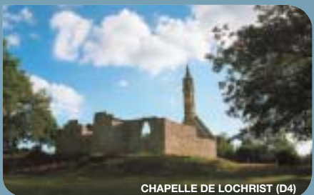
CHAPELLE DE LOCHRIST (D4)

Silicates d'aluminium et de fer. Curiosité géologique du sous-sol de la région de Coray, ces pierres se rencontrent en de rares endroits dans le monde, comme à Saint-Jacques de Compostelle (Espagne). Les staurotides sont appelées communément pierres de croix, car leur cristallisation en macles donne souvent cette forme.