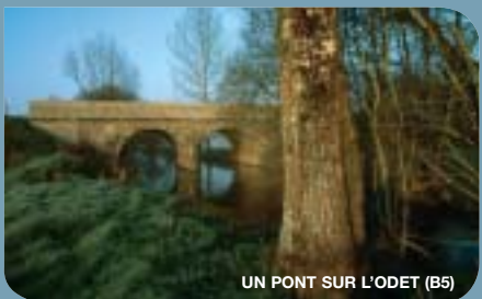
UN PONT SUR L'ODET (B5)