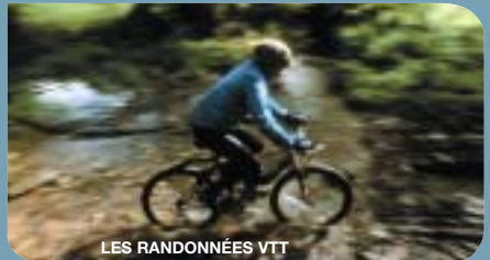
LES RANDONNÉES VTT