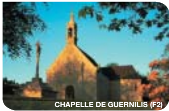
CHAPELLE DE GUERNILIS (F2)